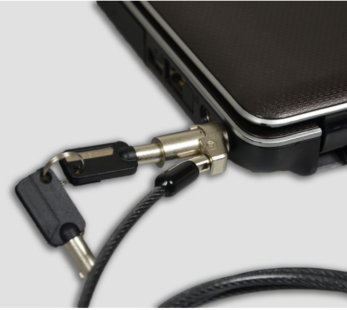
For laptop, desktop, monitors & other devices Pour ordinateur portable, ordinateur de bureau, moniteurs et autres appareils