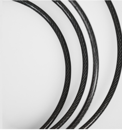
Steel braided security cable Câble de sécurité en acier tressé