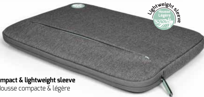
Compact & lightweight sleeve Housse compacte & légère