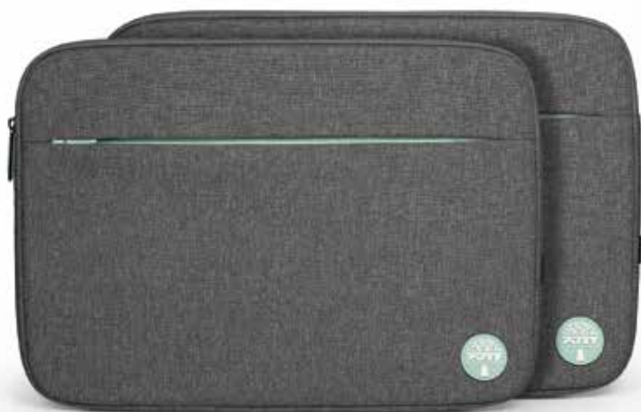
Laptop sleeves up to 13/14" and 15.6" Housses pour ordinateur portable jusqu'à 13/14" et 15.6"