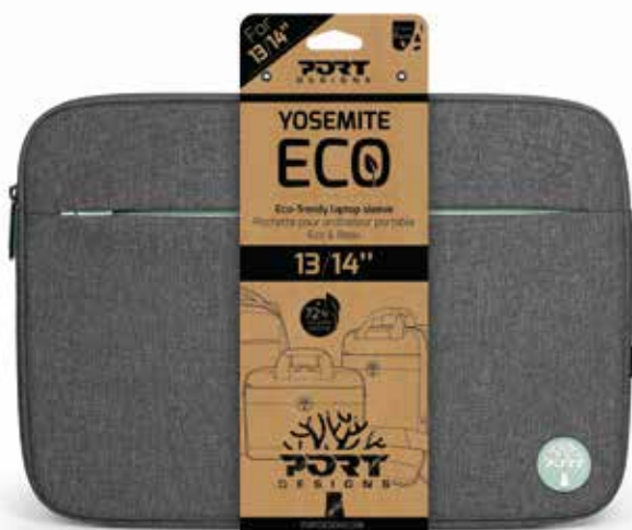
Carton kraft retail packaging front view Packaging retail en carton kraft vue de face