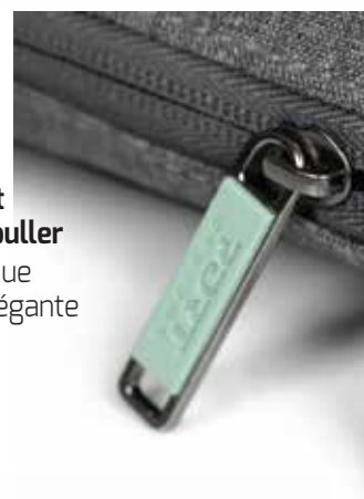
Ultra-resistant and trendy Metal puller Tirette métallique ultra résistante et élégante