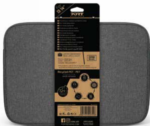
Carton kraft retail packaging back view Packaging retail en carton kraft vue arrière