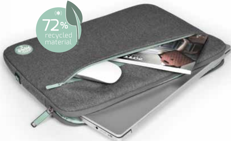
Large zipped front pocket for charger, smartphone and accessories Large poche avant zippée pratique pour transporter chargeur, smartphone et accessoires